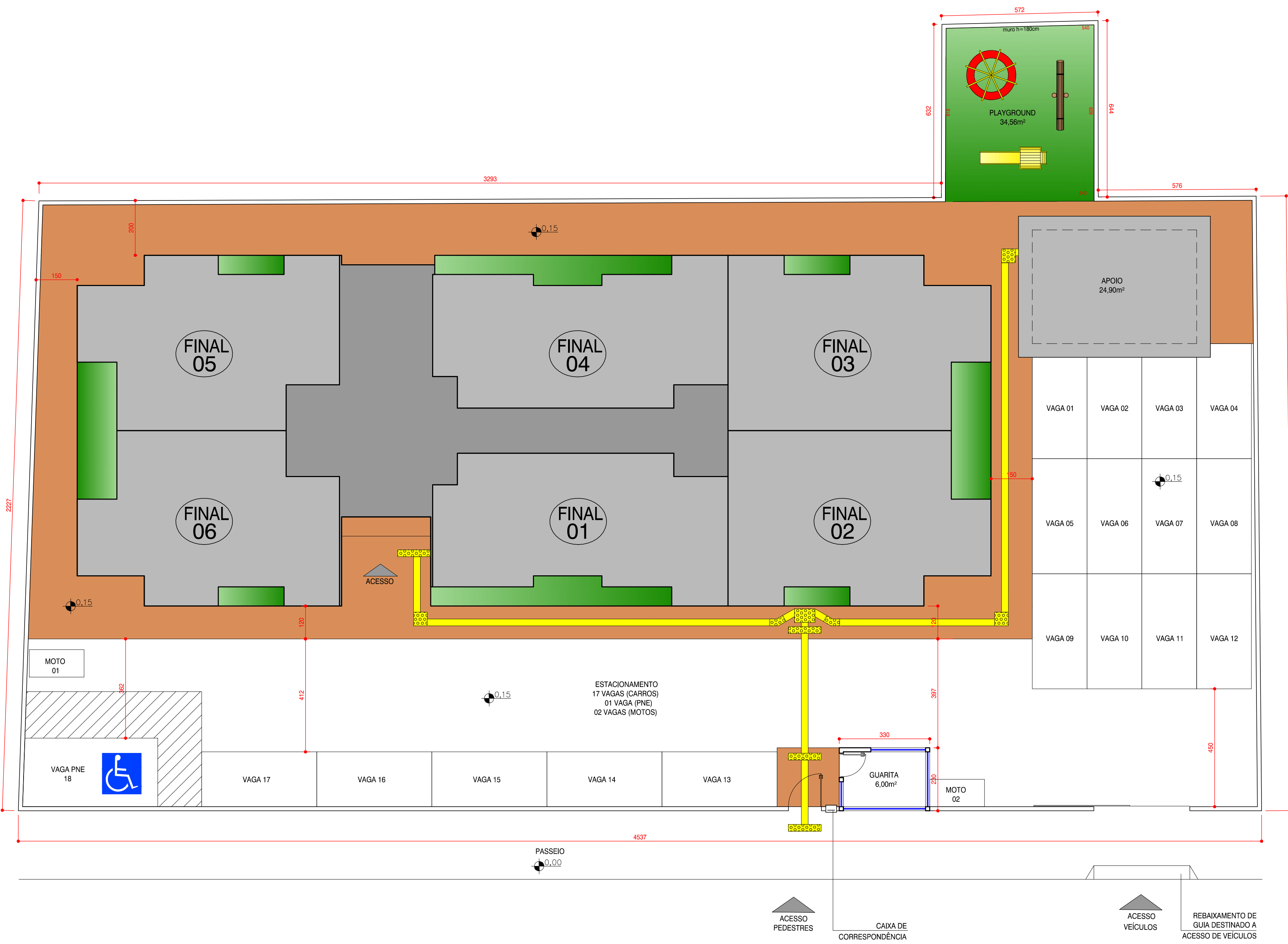
O1 IMPLANTAÇÃO 1:100